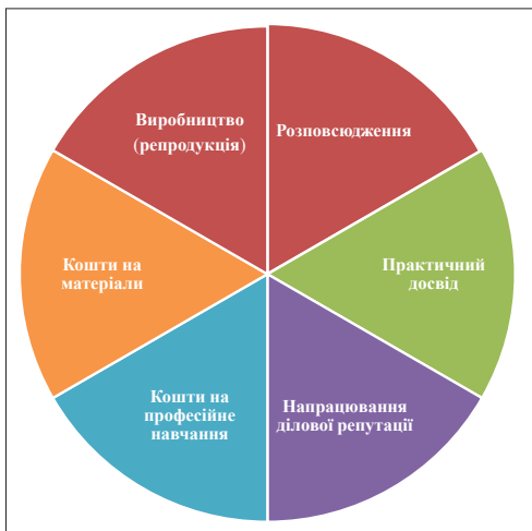
Мал. 1. Витрати правоводільця