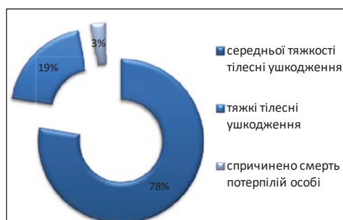
Рис. 3. Ступінь тяжкості тілесних ушкоджень, отриманих внаслідок вчинення неповнолітніми особами КДТП

розглядался Київським районним судом м. Одеси, а саме: 07.12.2013 приблизно о 13 годині 30 хвилині ОСОБА_2 порушив вимоги п.п. 1.5, 2.3 "б", 8.7.3 (г) та 12.3 Правил дорожнього руху України. Порушення виразилося у тому, що ОСОБА_2 керував технічно справним автомобілем Mazda-626, р/н НОМЕР_1 і здійснював рух напроти будинку № 19 по пр. Ак. Глушко з боку вул. Ак. Корольова в напрямку вул. Ільфа та Петрова, де мав об'єктивну можливість на достатній відстані побачити пішохода ОСОБА_1, який, перебуваючи у стані алкогольного сп'яніння та маючи слабкий зір, переходив проїжджу частину по пішохідному переходу на заборонений червоний сигнал світлофора. Однак водій, ОСОБА_2, був неухажним і не помітив зміни дорожньої обстановки, заходів щодо своєчасного зниження швидкості керуваного ним автомобіля аж до повної його зупинки не вжив, у результаті чого, рухаючись на заборонений жовтий сигнал світлофора, виїхав на вказаний пішохідний перехід, де скоїв наїзд на пішохода ОСОБА_1, який перетинав проїжджу частину в напрямку справа наліво стосовно лінії руху автомобіля [9].