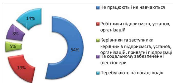
Рис. 1. Розподіл осіб, які вчинили КДТП, за соціальним статусом